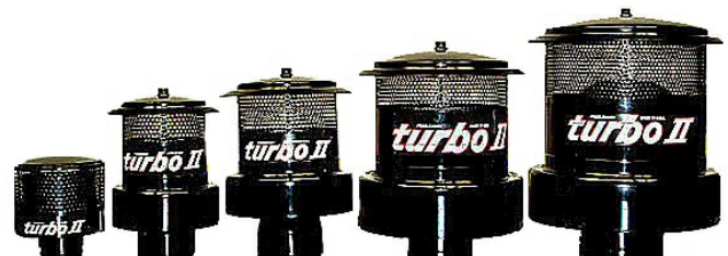
Modèle 13 18-37 KW Modèles 24 35-92 KW Modèle 35 88-132 KW Modèles 46 118-258 KW Modèles 68 220-405 KW