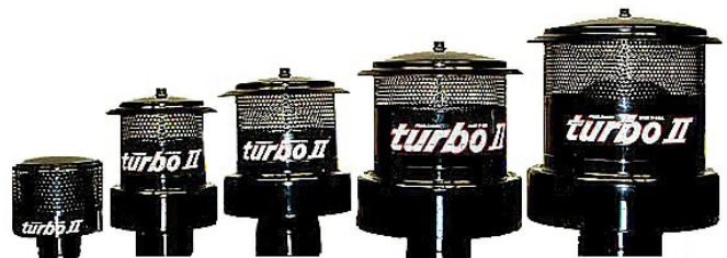
Modèle 13 18-37 KW Modèles 24 35-92 KW Modèle 35 88-132 KW Modèles 46 118-258 KW Modèles 68 220-405 KW