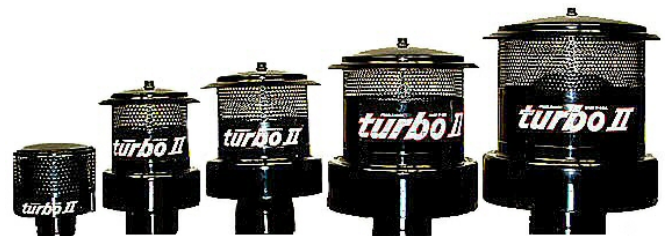
Modèle 13 18-37 KW Modèles 24 35-92 KW Modèle 35 88-132 KW Modèles 46 118-258 KW Modèles 68 220-405 KW