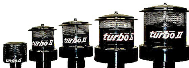
Modèle 13 18-37 KW Modèles 24 35-92 KW Modèle 35 88-132 KW Modèles 46 118-258 KW Modèles 68 220-405 KW