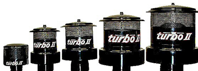
Modèle 13 18-37 KW