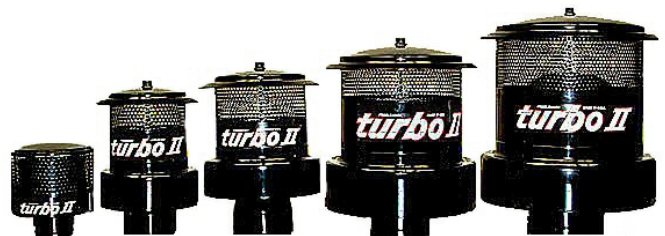
Modèle 13 18-37 KW Modèles 24 35-92 KW Modèle 35 88-132 KW Modèles 46 118-258 KW Modèles 68 220-405 KW