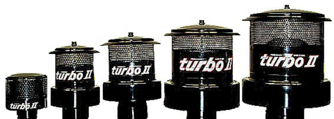
Modèle 13 18-37 KW