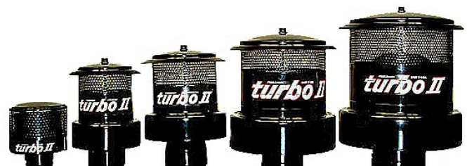
Modèle 13 18-37 KW Modèles 24 35-92 KW Modèle 35 88-132 KW Modèles 46 118-258 KW Modèles 68 220-405 KW