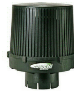
Modèle T3-4.5 73 - 186 KW