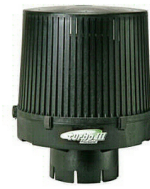
Modèle T3-4.5 73 - 186 KW