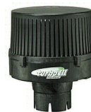
Modèle T3-3 / 4 18 - 93 KW