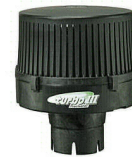
Modèle T3-3 / 4 18 - 93 KW