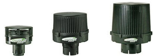
Modèle T3-2 5 - 30 KW