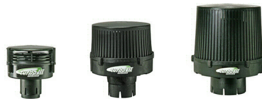
Modèle T3-2 5 - 30 KW