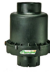
Modèle TB-4.5 Flex In Line 79 - 185 KW