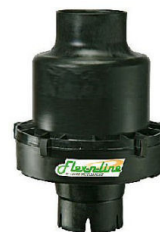
Modèle TB-3 Flex In Line 27 - 81 KW

Débit d'air Min/Max(en L/s) 35 à 106 L/s